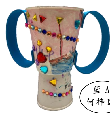
藍 A 何梓匡