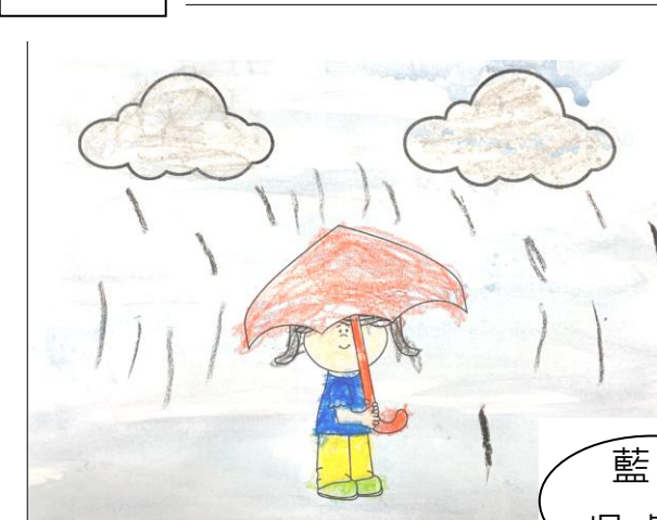
藍 A 吳卓藍