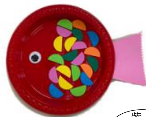
紫 B 楊銘璋